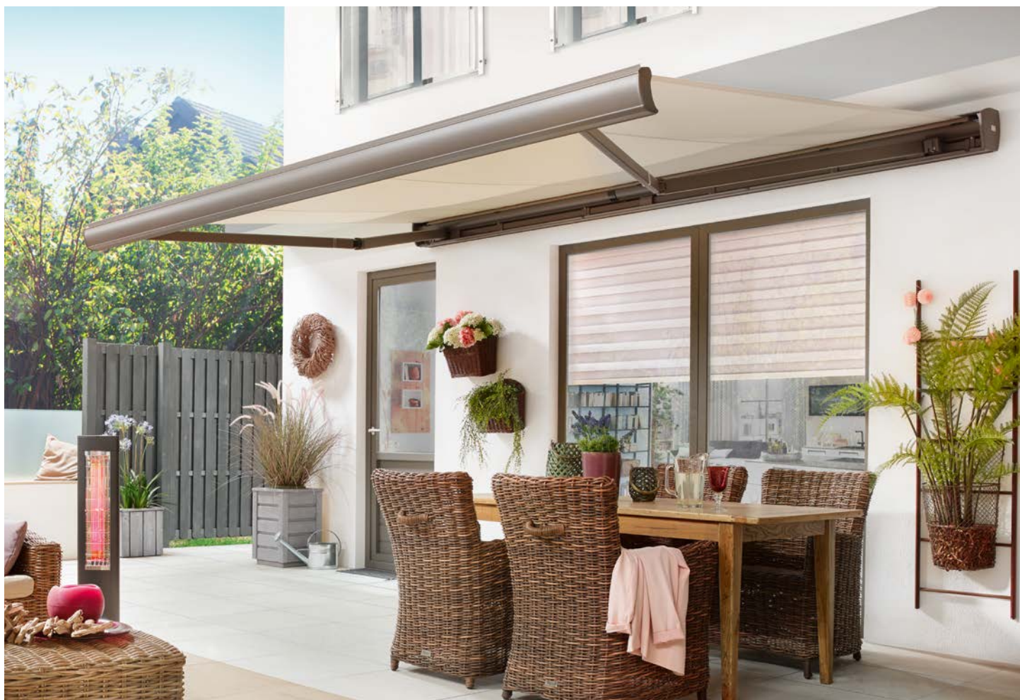
Kompaktes Design mit hohem Komfort und hervorragender Technik.

Klassisches Design, überlegene Qualität, einfache Bedienbarkeit und solide Wertbeständigkeit: Die Family Compact vereint die Schutzfunktion einer Kassettenmarkise mit dem Montagekomfort einer Tragrohr-Markise.